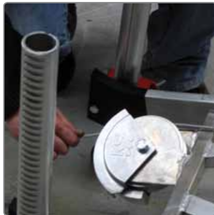
Sichere Lastführung über eine Umlenkrolle.

Für den Transport lässt sich der KS Markilift, der aus Aluminium besteht, in vier Einzelteile zerlegen und durch das geringe Gewicht bequem in das Transportfahrzeug verladen.