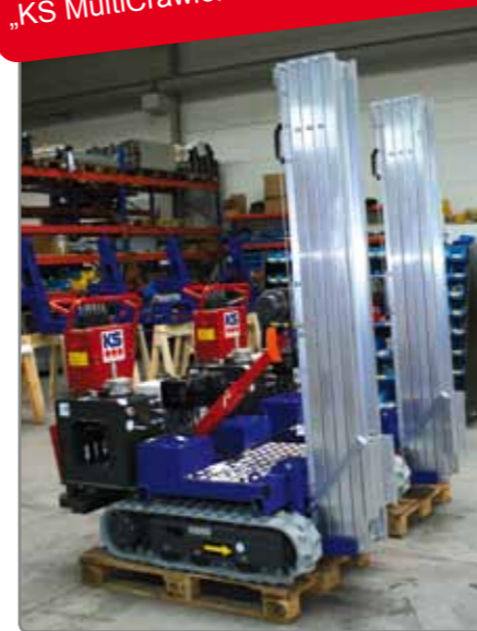
Wir laden Sie in unser Werk nach Emsbüren ein, um die KS Hebegegeräte live zu erleben.

Weitere Lifte finden Sie in unseren Prospekten „KS MultiCrawler“ und „KS Robots“