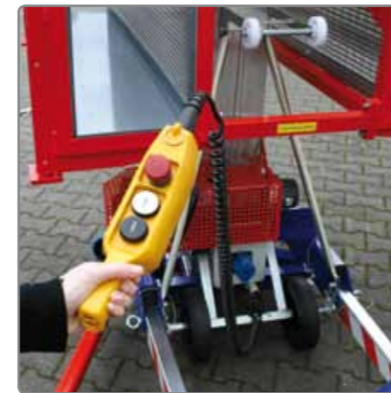
Eine Kabelfernbedienung* sorgt für einen höheren Bedienkomfort.

Gut zu wissen, dass es eine preis- wertige Möglichkeit gibt, den KS Glas- max zu erweitern.