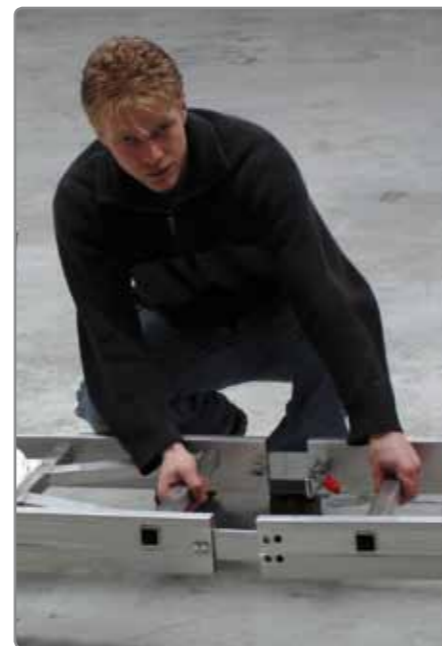
Zusammenstecken, festspannen ...