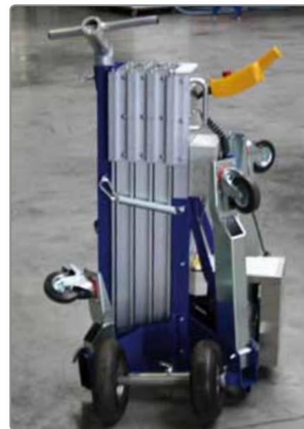
Der KS WIGA ist kompakt konstruiert und platzsparend zusammenklappbar.