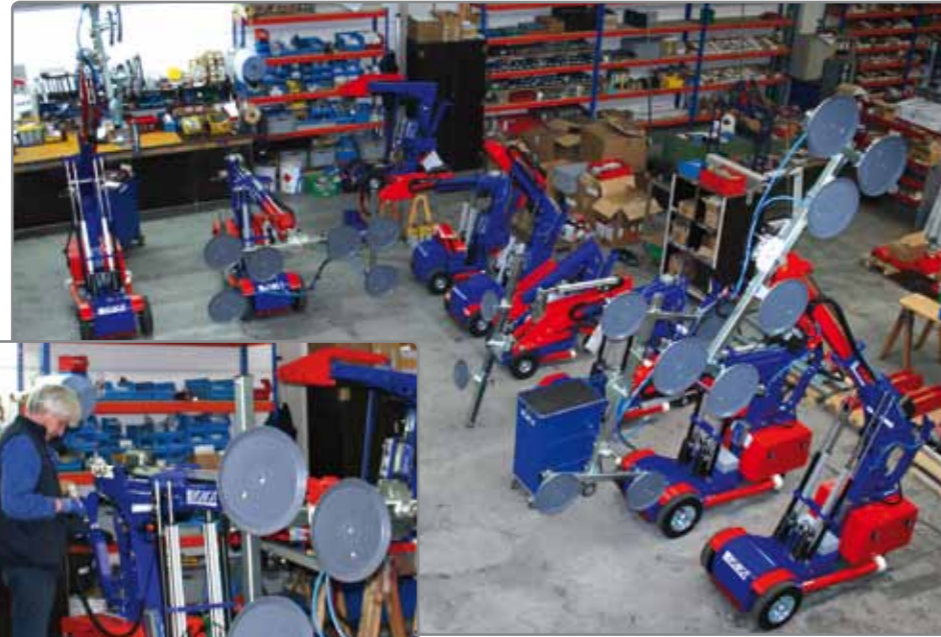
Gute Produkte und zufriedene Kunden stehen bei uns an erster Stelle.