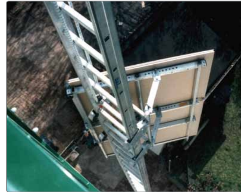
Über eine motorisch betriebene Seilwinde wird das Material absolut sicher in die gewünschte Etage transportiert. Ein schonender Transport, sanftes Anfahren und Stoppen zeichnen den KS MAZ aus.

Der Materialaufzug KS MAZ ersetzt ein ganzes Helfer-Team. Die Bedienung ist besonders einfach und benutzerfreundlich. Über eine elektrisch angetriebene Seilwinde wird das Material in das gewünschte Stockwerk befördert. Der KS MAZ zeichnet sich durch sanftes Anfahren und Stoppen mittels Frequenzumrichter aus. Besonders bei Umzügen mit zerbrechlichen oder wertvollen Gütern ist dies ein großer Vorteil.