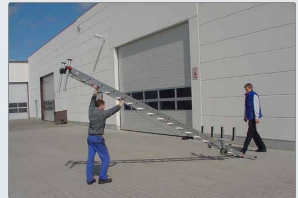
aufstellen, fertig ist die Montage.