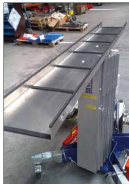
Auf Wunsch ist die Ausstattung mit einer Markisenaufnahme* möglich.