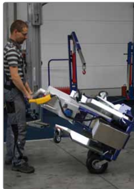
Luftbereifung* für einen bequemen Transport des KS WIGAs.

Der Spindeltrieb läuft besonders sanft, wodurch ein maßgenaues Einsetzen der Glasscheibe in der Horizontalen zum Kinderspiel wird. Das bringt vor allem eine körperliche Entlastung der Monteure und spart zudem noch Montagezeit.