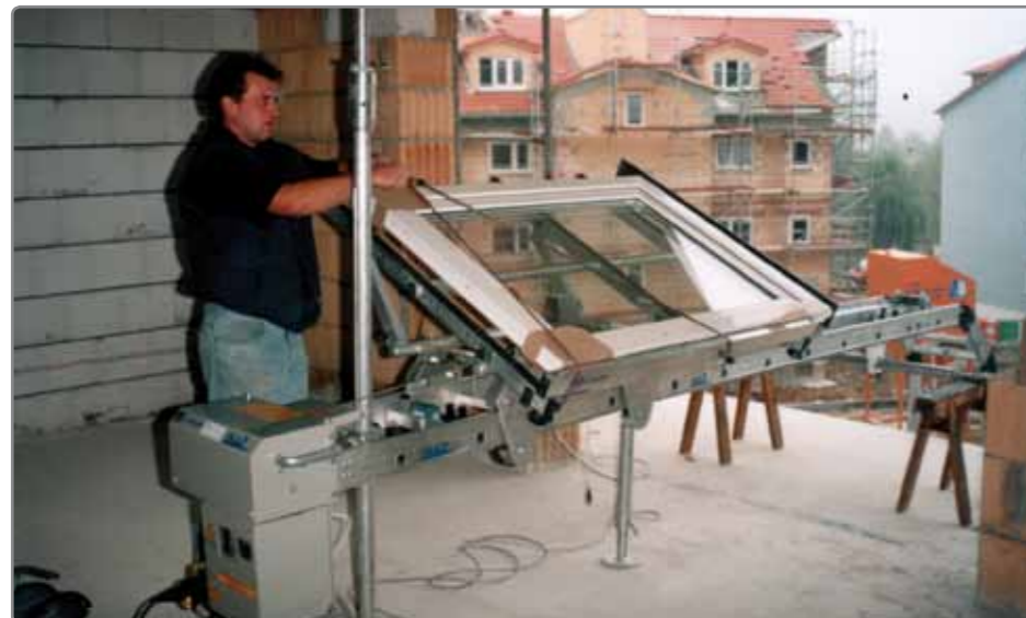
Die Baumaterialien werden senkrecht nach oben und waagrecht in den Raum transportiert, so können sie bequem abgeladen werden.