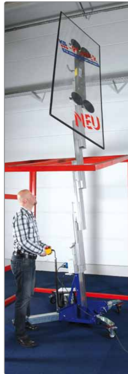
Die Hubsäule lässt sich komfortabel auf die gewünschte Einbauhöhe bringen.

Ganz neu ist die Ausstattung mit großen Luftreifen*, die immer dann zum Einsatz kommen, wenn der WIGA auf die Baustelle transportiert wird. Kompakt zusammengeklappt, lässt er sich so leicht rollen und zum Einsatzort bringen. Der KS WIGA zeichnet sich durch sein spezielles Dreh-Knick-Gelenk aus. Dadurch ist er enorm beweglich und kann große Scheiben sehr passgenau einsetzen.