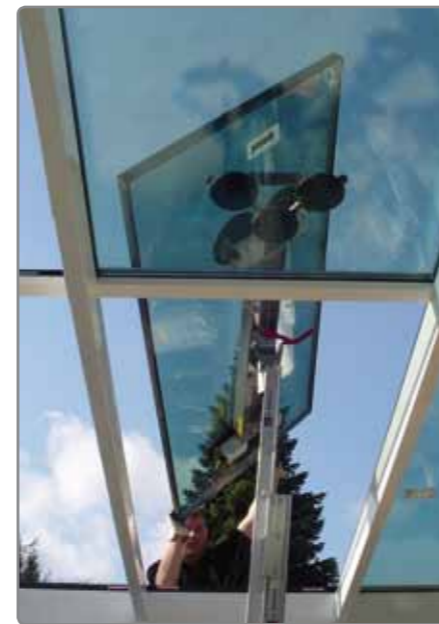
Das sehr bewegliche Dreh-Knick-Gelenk sorgt für ein exaktes Einsetzen der Scheibe.