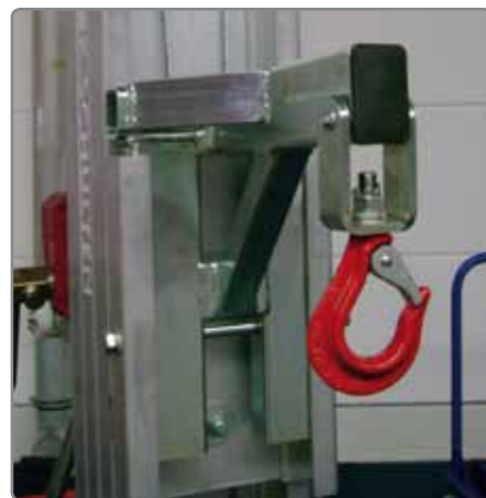
Hakenadapter, z.B. zur Aufnahme einer Saugereinheit oder eines Hebegurtes.