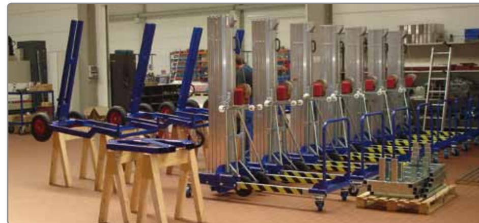
Die Bauteile werden in eigenen Werkstätten ausschließlich in Deutschland gefertigt und montiert.

Weitere Lifte finden Sie in unseren Prospekten „KS MultiCrawler“ und „KS Robots“