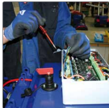
Von gut ausgebildeten Spezialisten hergestellt.

Unsere Arretiermaschinen für Roll-ladenpanzer und Prüfanlagen für Fenster, Türen, Fassaden und Tore sind weltweit im Einsatz. Fragen Sie an, wir beraten Sie gerne.