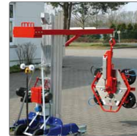
Spezialaufnahme* für KS VacuPower ragt weiter nach vorne über die Räder zum Überbrücken von Hindernissen.