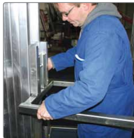
Lastgabel für die Montage und zum Transport von schweren, sperrigen Lasten.