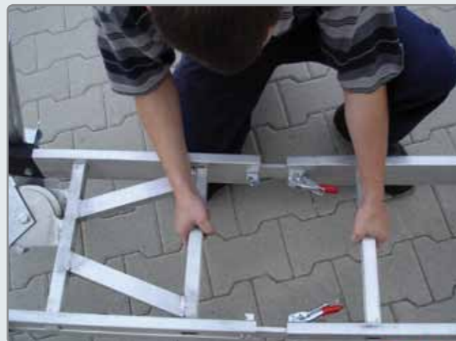
Ein Stecksystem mit Schnellspannern garantiert einen schnellen Aufbau.