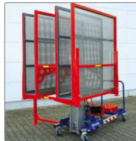
Transportkorb dient zum Heben von Fenstern, Gläsern und sperrigen Platten.