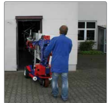
Bevor die KS Robots das Werk verlassen, durchlaufen sie eine Testphase.