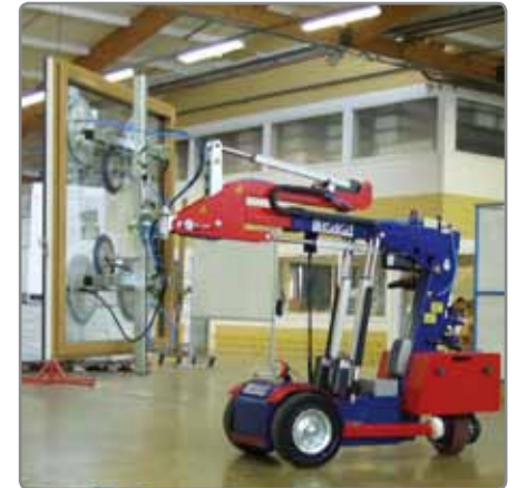
KS Robot 280 im Einsatz bei einem französischen Fensterhersteller.