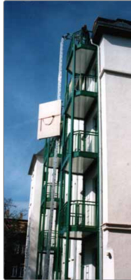
Auf engstem Raum und bis zu einer Höhe von maximal 15 m befördert der KS MAZ die Bauteile.

Der KS MAZ besteht aus Aluminium. Ein spezielles Stecksystem ermöglicht einen schnellen Aufbau. Beim Transport und im Einsatz auf der Baustelle benötigt der KS MAZ nur wenig Platz. Ideal sind die unterschiedlichen, schnell umzurüstenden Transportaufsätze für Fenster, Eimer, Fliesen, Schüttgut, Einrichtungsgegenstände und Innenausbauten aller Art.