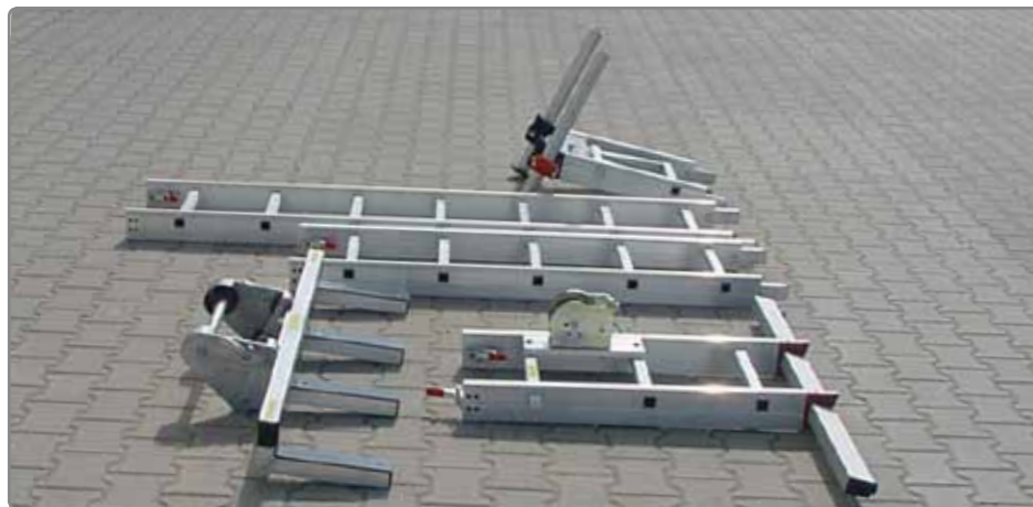
Fünf leichte Teile aus Aluminium bilden den Baukasten des KS Markiliftes.