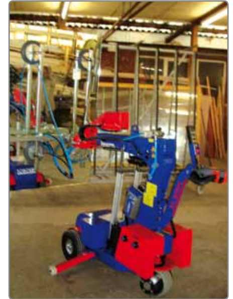
Wer ist der Schönste im ganzen Land? KS Robot 280 im Einsatz in einer Spiegelfabrik.