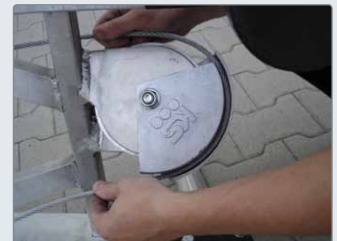
Die Lastführung erfolgt über eine stabile Drahtseilumlenkung.