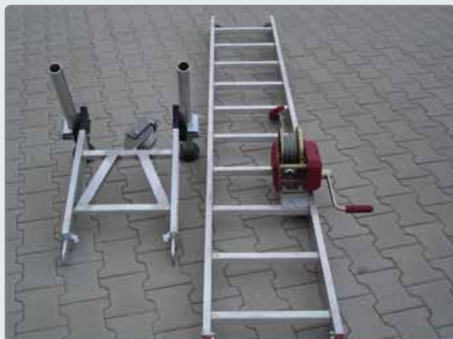
Der KS Jack besteht aus zwei leichten Aluminiumteilen.