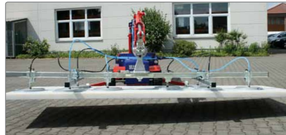
Wir machen Wünsche wahr - schildern Sie uns Ihren Anwendungsfall und wir bieten Ihnen eine maßgeschneiderte Lösung.

Wir sind gerne für Sie da und setzen effizienzsteigernde Projekte in Ihrem Betrieb gemeinsam um.