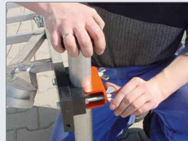
Die seitlichen Stützen werden mittels Flügelmuttern fixiert.