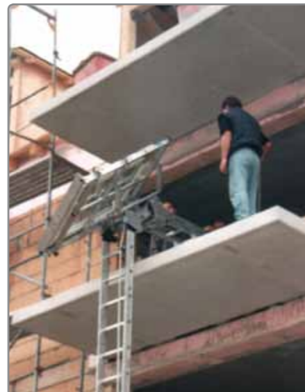
KS MAZ - senkrechter Materialaufzug parallel zur Hauswand.